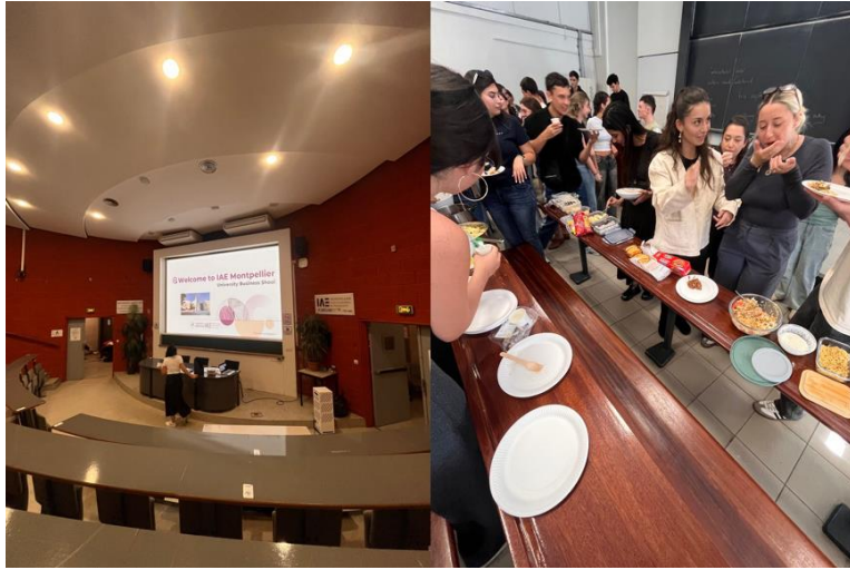
學院教室和課堂活動